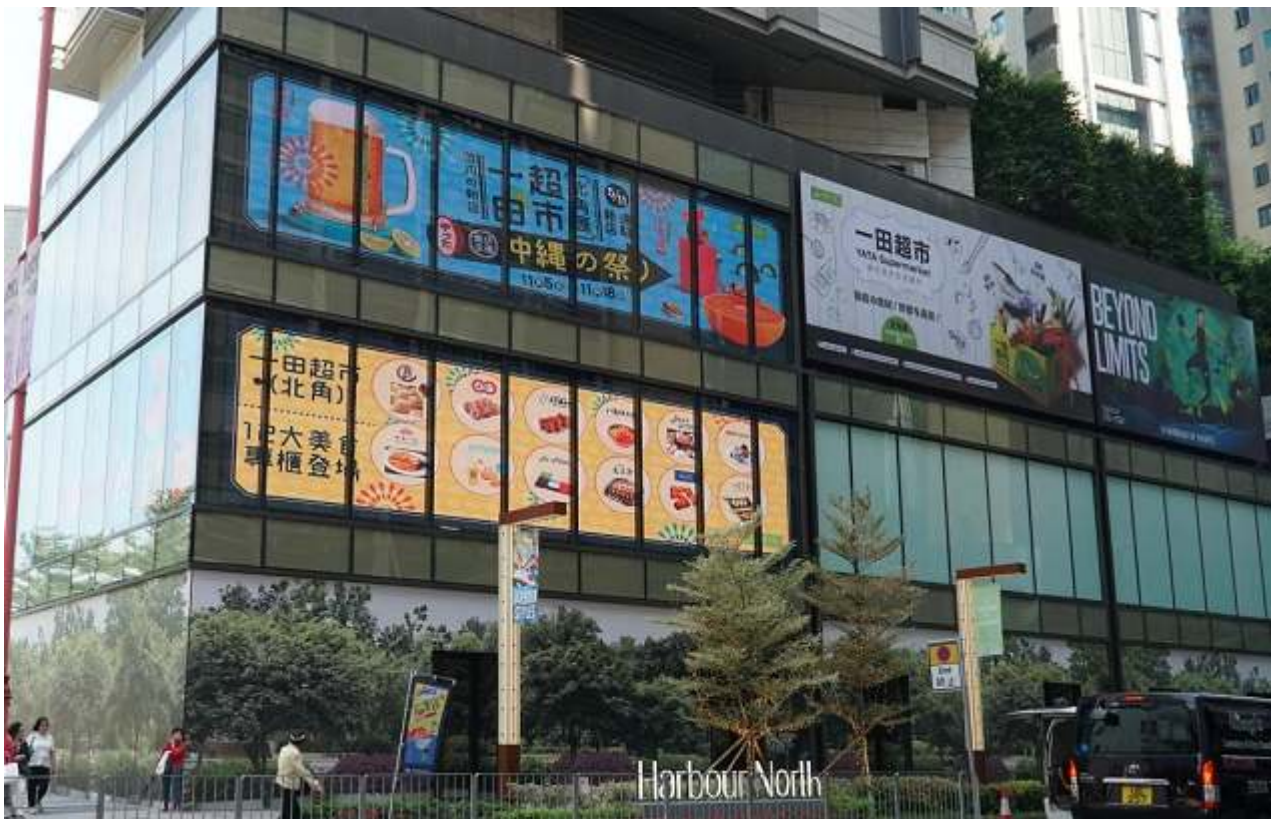
2019年11月 マンションの向かいに一田（旧西友系スーパー）がオープン。