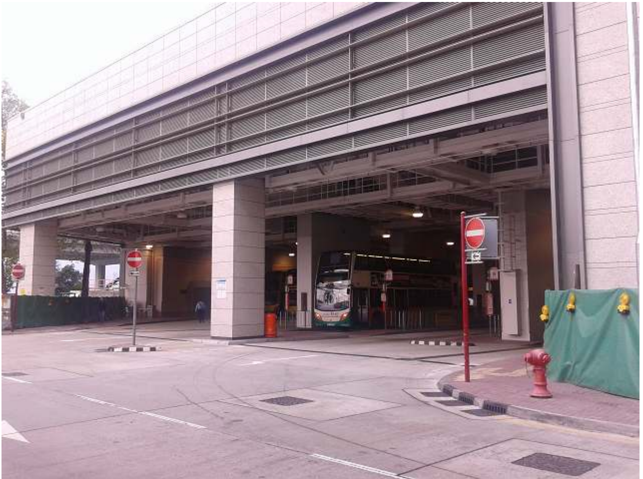
マンション向かいのバスターミナル 日本人学校まで始発の2本バスルート No.41A No.63