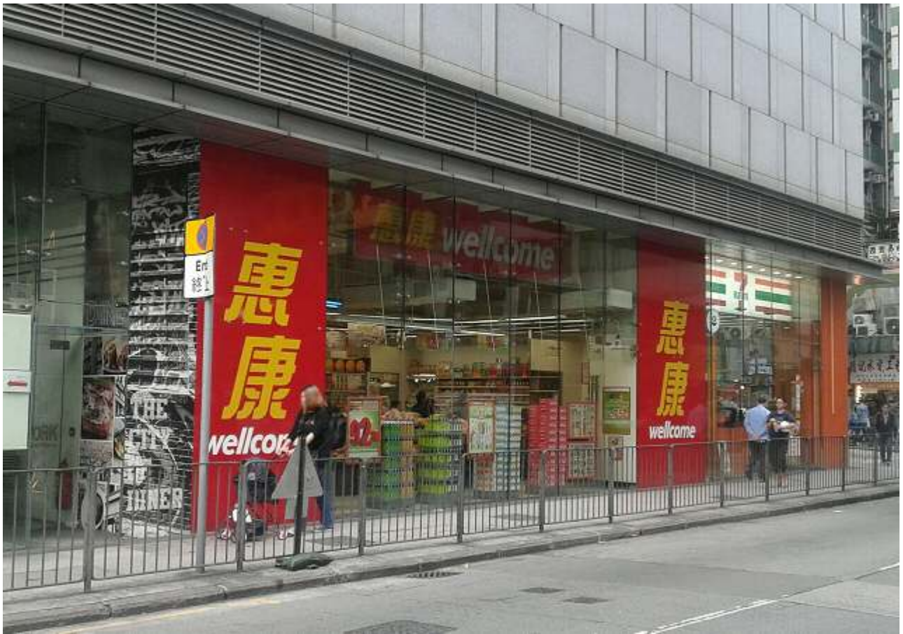
マンション下層部にスーパーマーケット・セブンイレブン